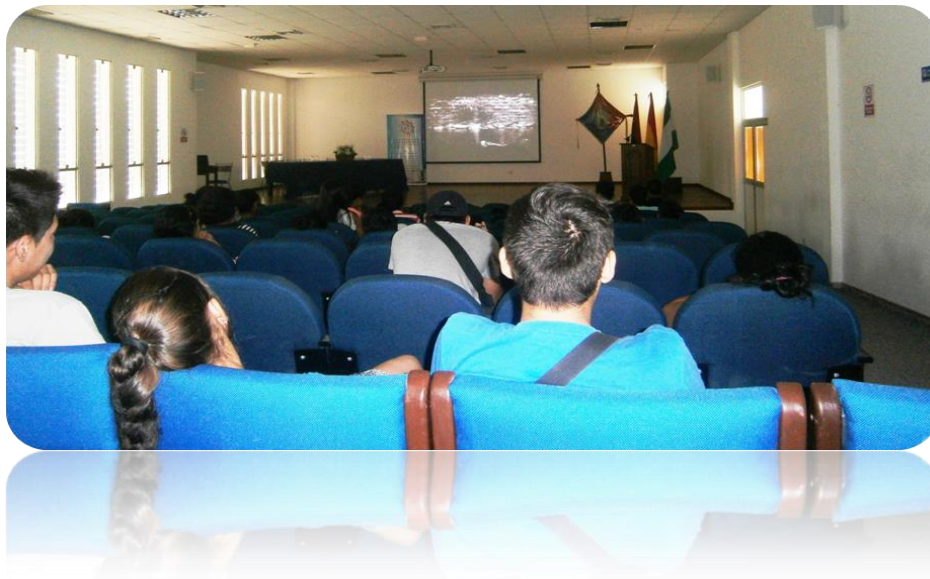
ASISTENCIA A LAS PROYECCIONES DE PELICULAS

Iniciamos el 2013 los días jueves a las 18:30. El 2014 a pedido de los estudiantes se cambió a las 11:30 la mañana, esta actividad fue perfeccionando la técnica del debate y análisis de las películas para que los asistentes puedan participar de manera más activa. Entre marzo y noviembre tuvimos 29 sesiones de proyección de películas para el cine debate, llegando a 1220 asistentes durante este periodo.