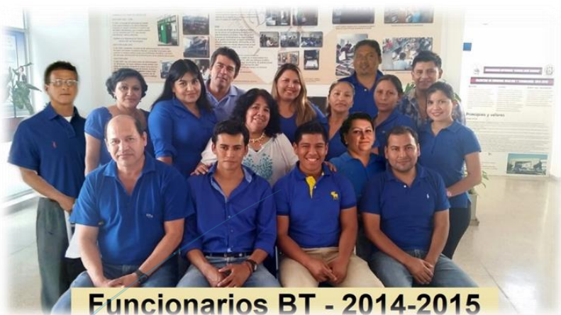
Funcionarios BT - 2014-2015